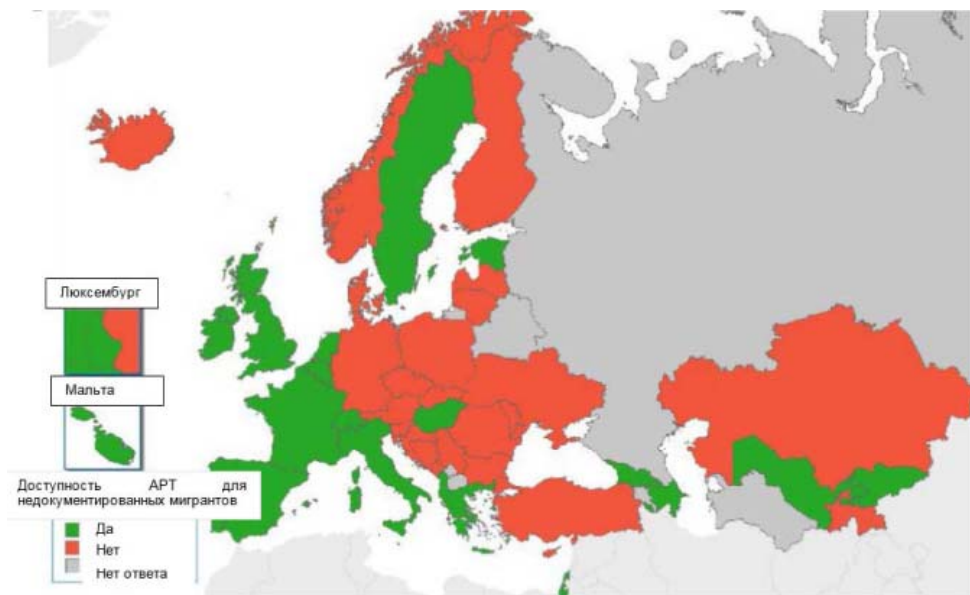
Рис. 3. Доступность АРТ для недокументированных мигрантов в Европе и Центральной Азии (ECDC, 2017)

экономической зоны (ЕЭЗ) и семь стран – не членов ЕС/ЕЭЗ) заявили о том, что они предоставляют бесплатный доступ АРТ для недокументированных мигрантов (ECDC, 2017) (рис. 3).