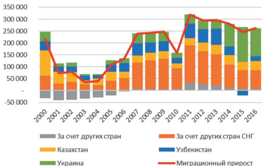
Рис. 4. Миграционный прирост в России, 2000-2016, чел. (Росстат, 2018а)